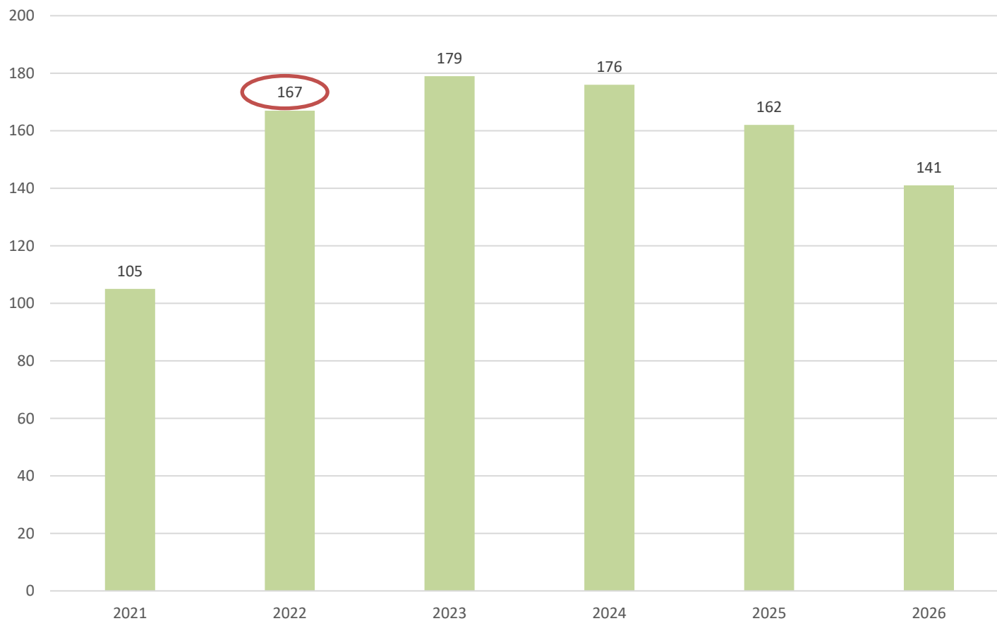
Numero progetti finanziati ogni anno